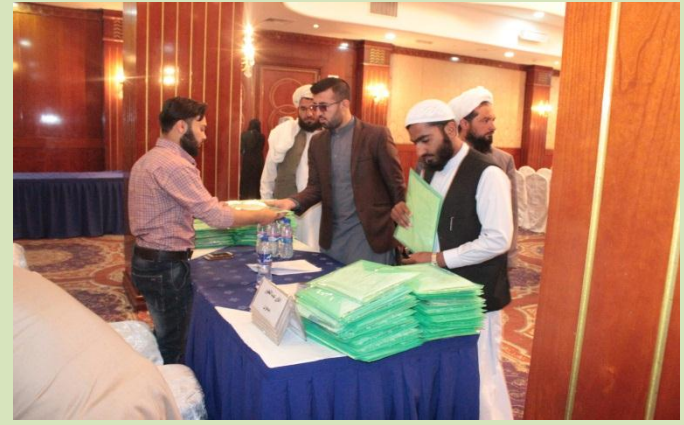
کنفرانس سالانه نهضة العلماء افغانستان، تحت عنوان محبت با انسانیت، نقش علما در صلح پایدار، انکشاف و احترام به حقوق بشر