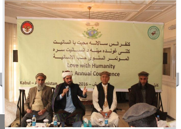
کنفرانس سالانه نهضة العلماء افغانستان، تحت عنوان محبت با انسانیت