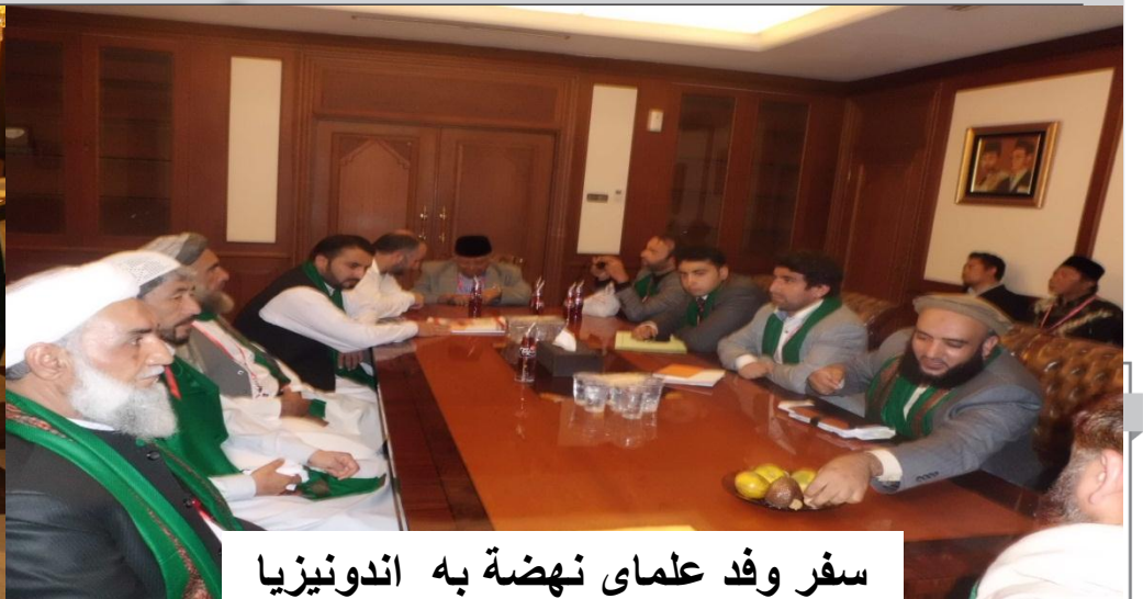
سفر وفد علمای نهضة به اندونیزیا