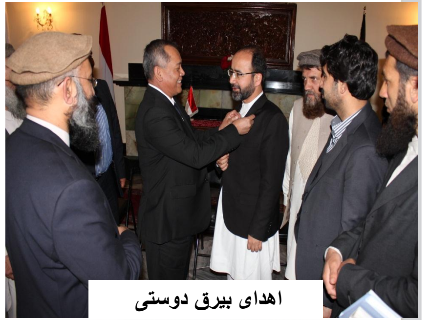
اهدای بیرق دوستی